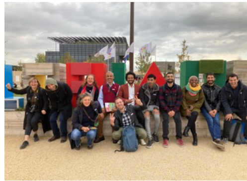
Floriade social builders: → City Deal Nieuwsbrief