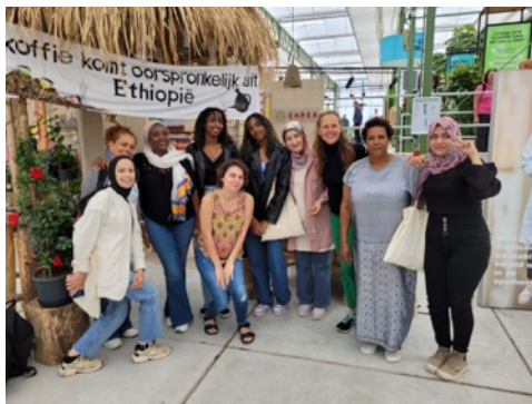
Floriade Vrouwencoalitie met Habesha Spirit