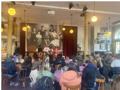
600 studenten sociaal werk en hun docenten ontmoeten tijdens twaalf verhalenworkshops nieuwe burgers