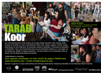
Repetities in Verhalenhuis Belvédère