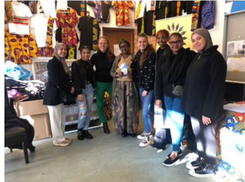
Krachtvrouwen Rotterdam West